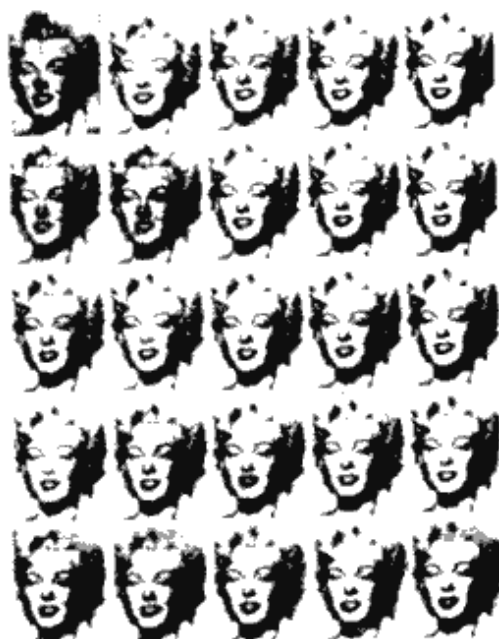
ANDY WARHOL, Marilyn Monroe, 1962. Óleo sobre tela, 81 x 55 3/4