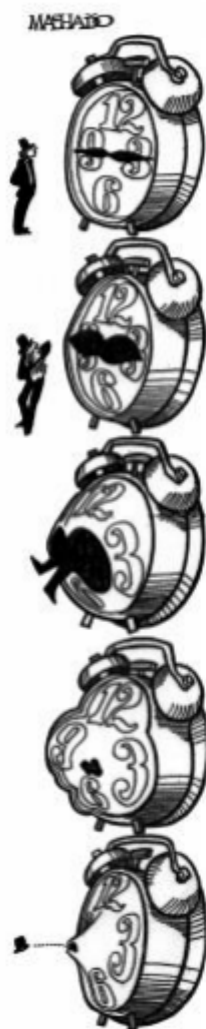
MACHADO, Juarez. Jornal do Brasil , 1972.