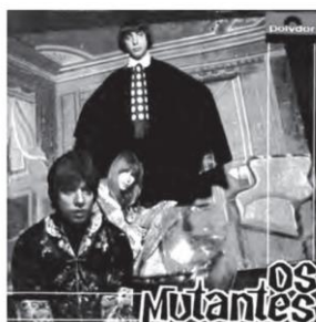
Capa do LP Os Mutantes, 1968.