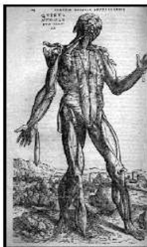
Ilustração de Andreas Vesalius na obra "Da Organização do Corpo Humano".