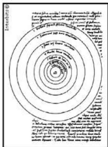
Ilustração do Sistema solar no manuscrito de Copérnico na obra "Das Revoluções das esferas celestes".

1. As imagens abaixo ilustram alguns procedimentos utilizados por um novo modo de conhecer e explicar a realidade que se estruturou entre os séculos XVI e XVIII.