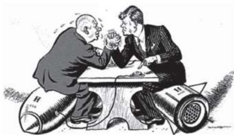
Kennedy e Khrushchev, em charge de 1962.

Disponível em: < http://cmais.com.br/aloescola/historia/guerrafria/index.htm >. Acesso em: 11 set. 2013.