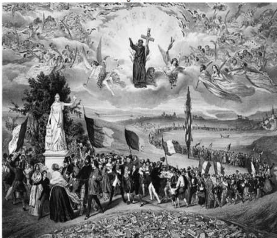
Fig. 1 - Fraternidade ( Fraternité ). Litogravura de F. Sorrieu, 1848, França.