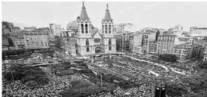
Comício na Praça da Sé - 1984

Os comícios que atraíram milhares de pessoas em todo o país eram realizados em defesa