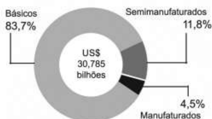
Vendas do Brasil para a China